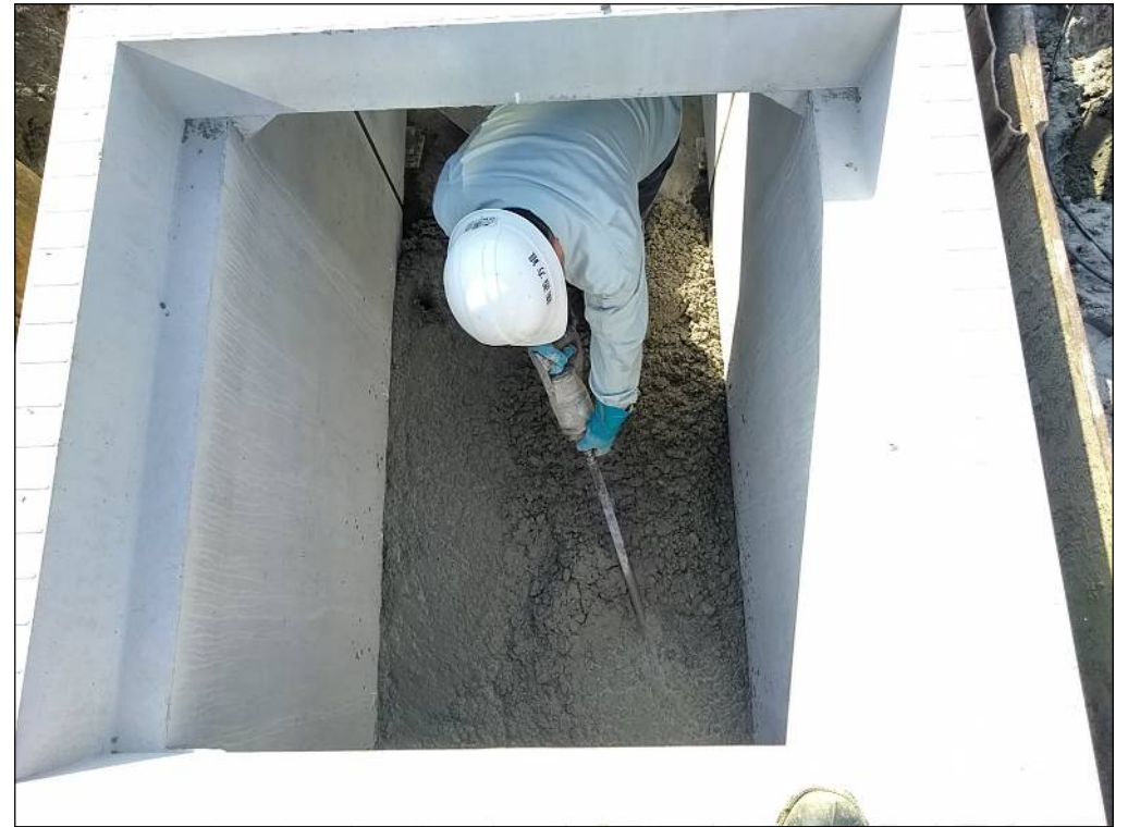
調整コンクリート打設作業