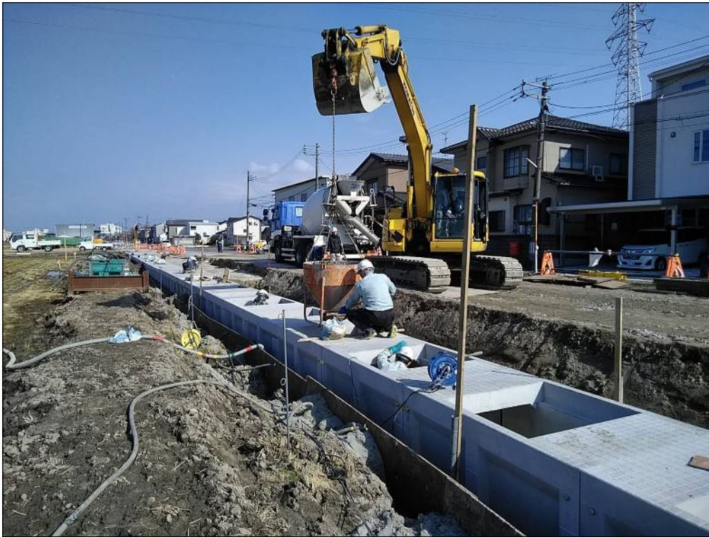
調整コンクリート打設作業