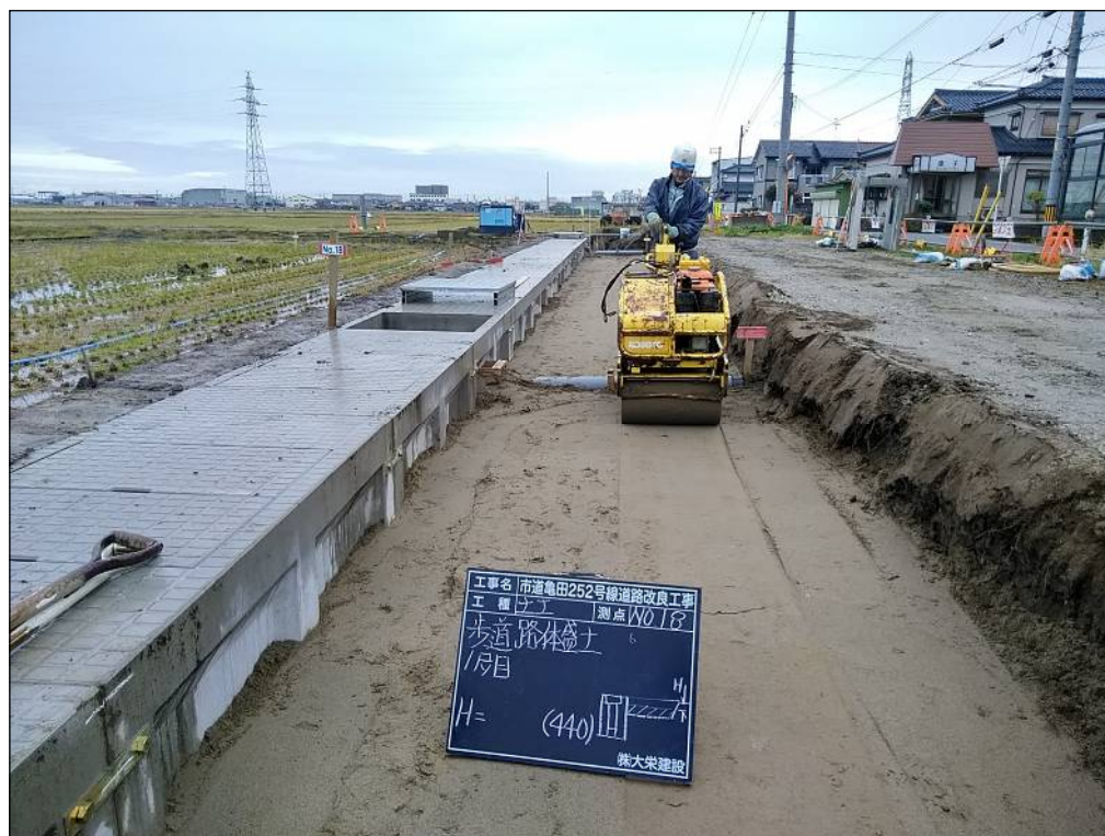
歩道路体盛土作業