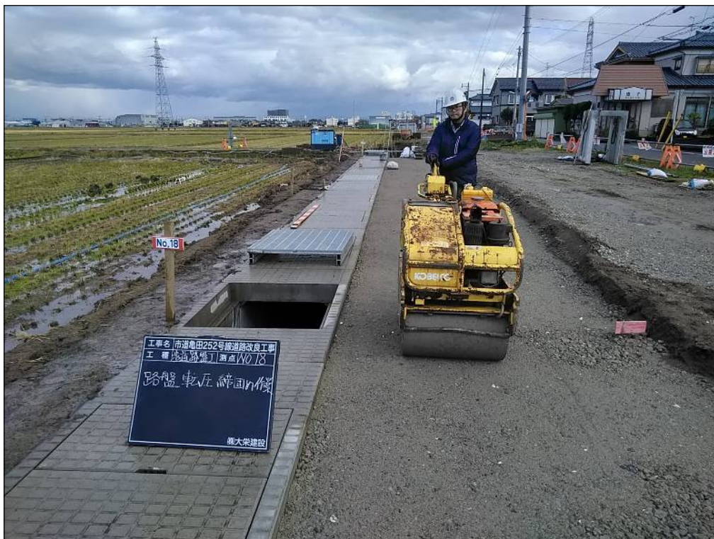
路盤転圧締固め作業