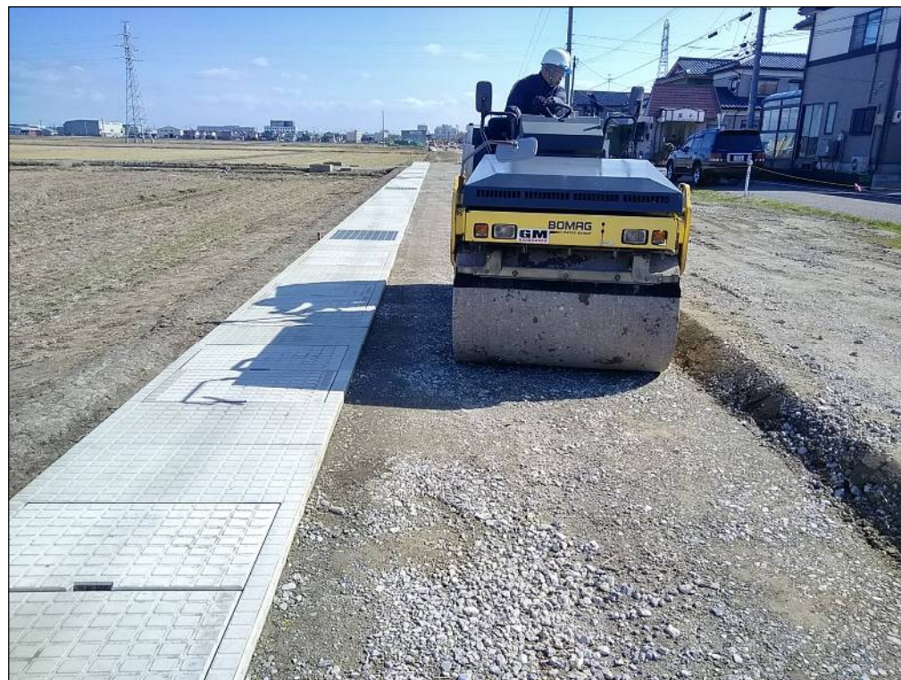
路盤転圧締固め作業