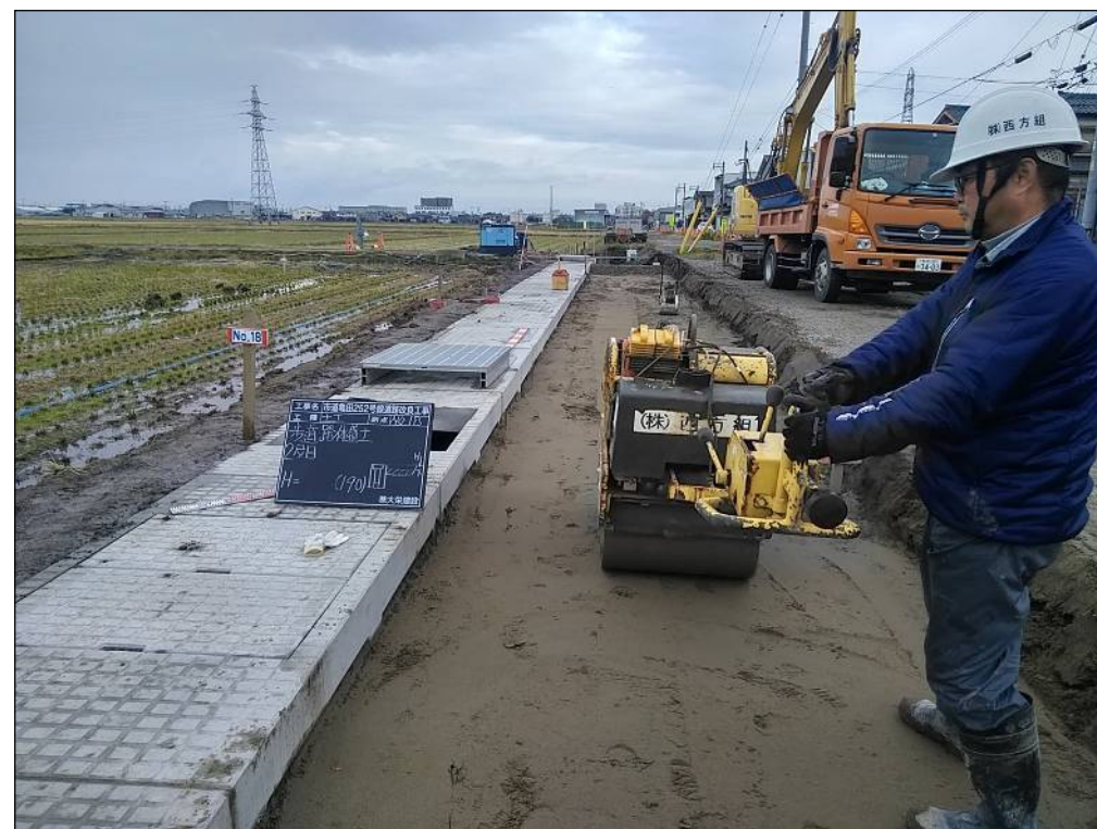
歩道路体盛土作業